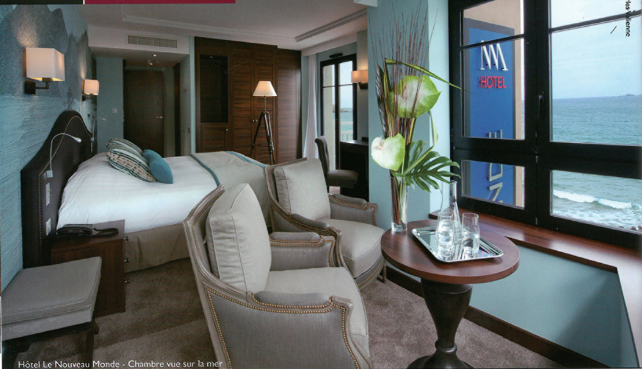
Hôtel Le Nouveau Monde - Chambre vue sur la mer