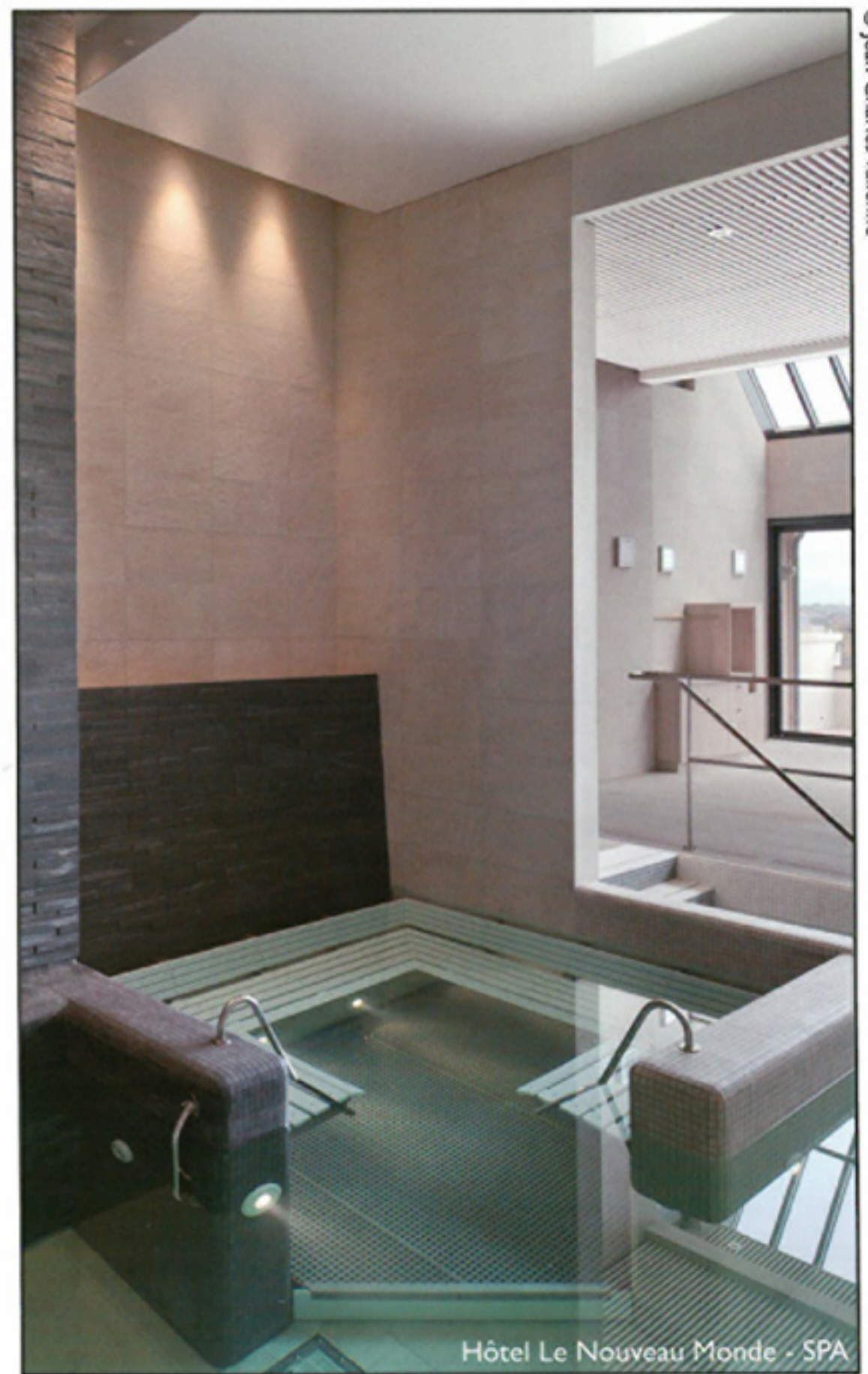
Hôtel Le Nouveau Monde - SPA

On se détend dans le hammam. On se repose dans un espace lounge, on se réchauffe au solarium, qui s'ouvre sur une vaste verrière et terrasse plein sud avec une très belle vue sur les bassins de Saint-Malo. L'espace SPA de 250 m 2 vous accueille et propose une large offre de soins visages et corps. On se fait chouchouter le temps d'un soin, d'un gommage, d'un modelage grâce à la gamme cosmétique des Thermes Marins de Saint-Malo et selon des rituels inspirés du monde entier.