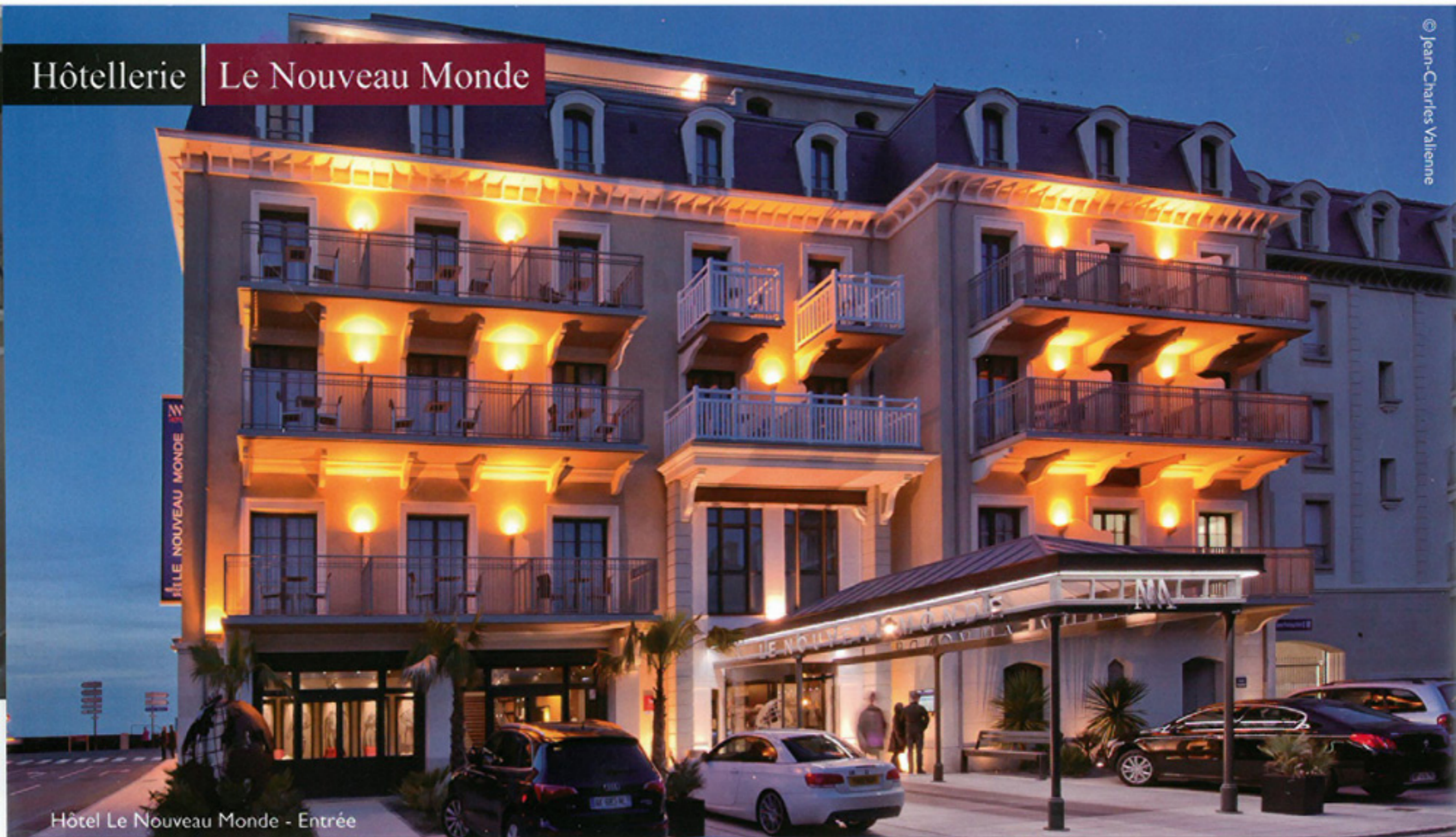
Hôtel Le Nouveau Monde - Entrée