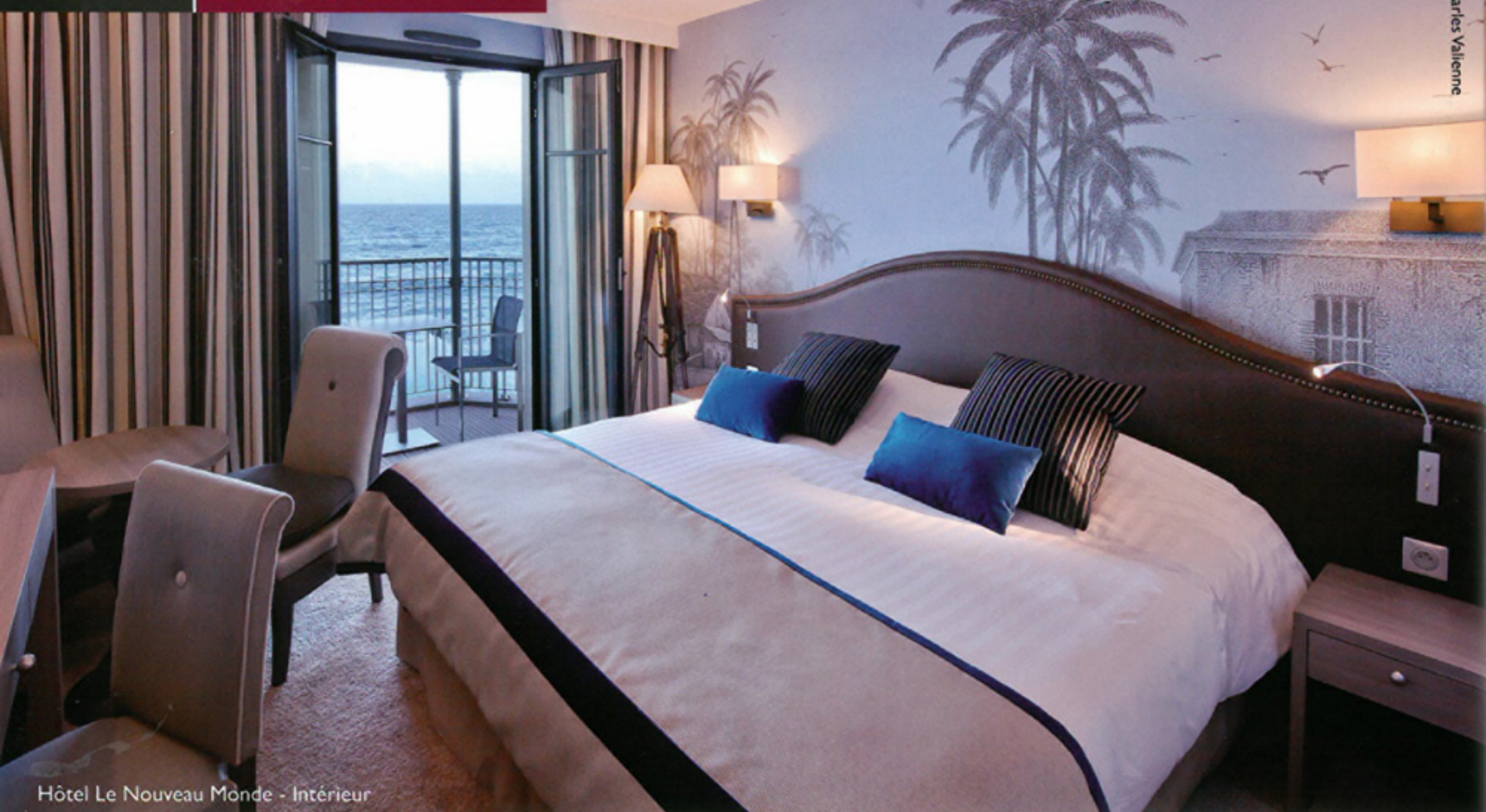
Hôtel Le Nouveau Monde - Intérieur