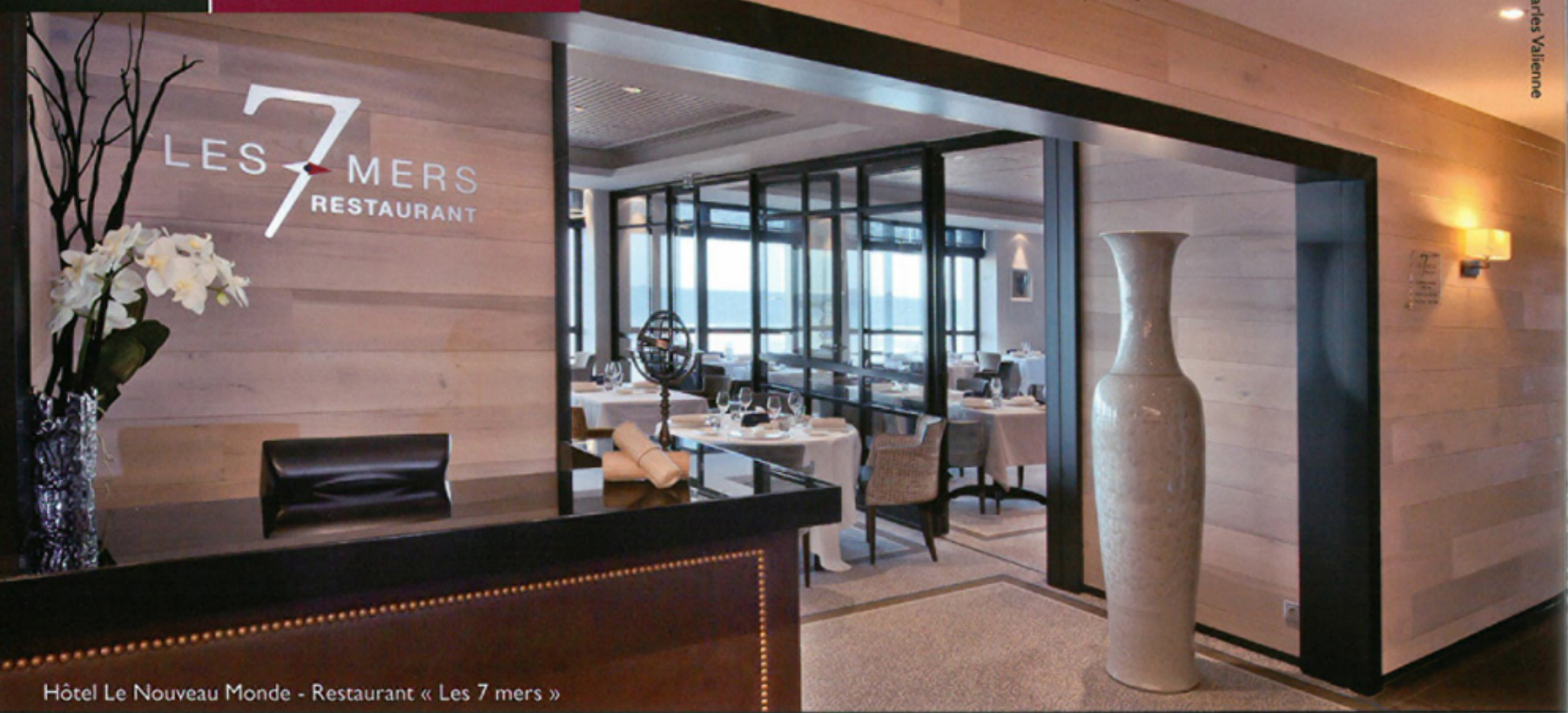
Hôtel Le Nouveau Monde - Restaurant « Les 7 mers »